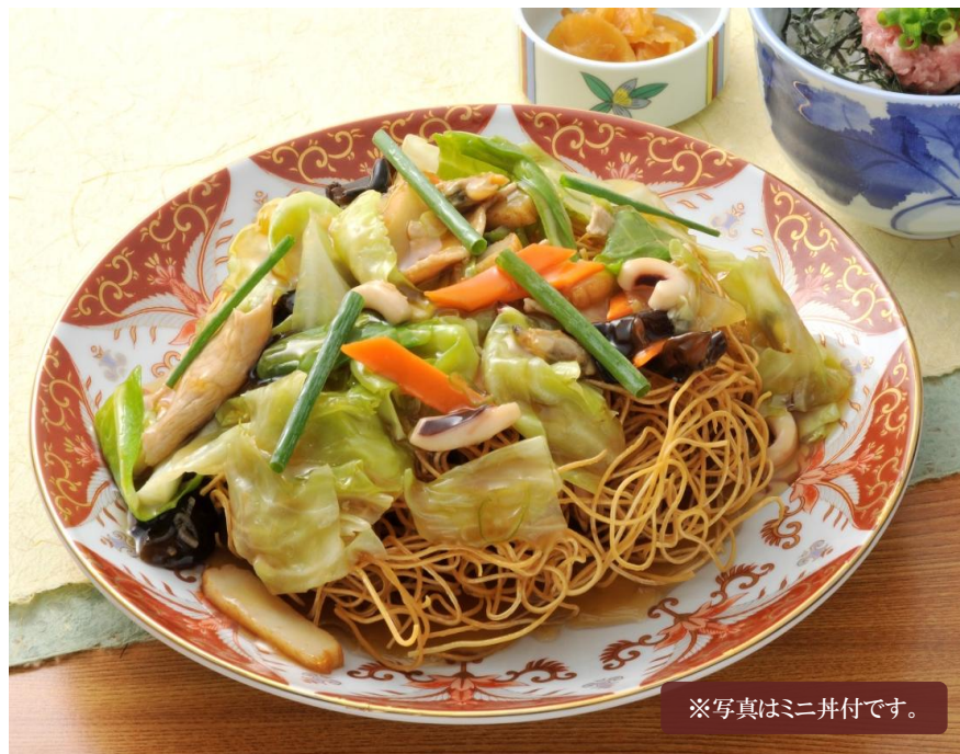
※写真はミニ井付です。

皿うどん 1,146円 (税込 1260円) ミニ井付 プラス 319円 (税込 350円)