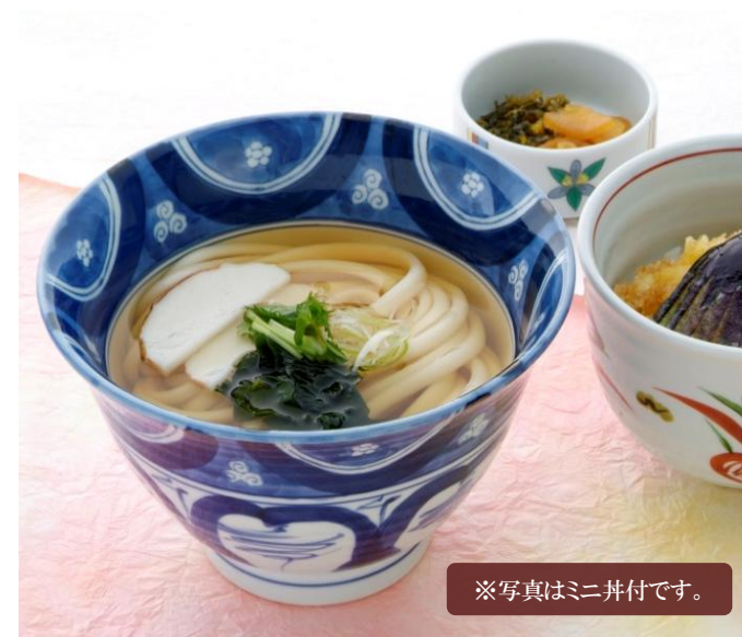
※写真はミニ丼付です。

鶏肉を煮込んだスープに、塩麴を加えました。 あっさりとした塩味のスープを、柚子と胡椒の香りでお楽しみください。