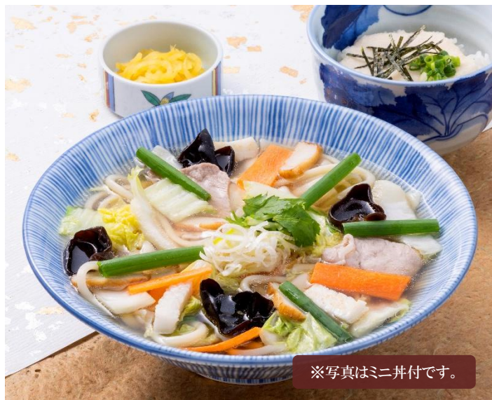
※写真はミニ丼付です。