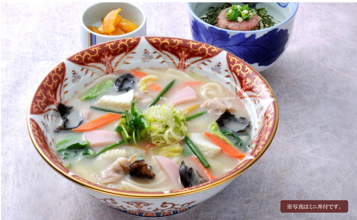
※写真はミニ丼付です。