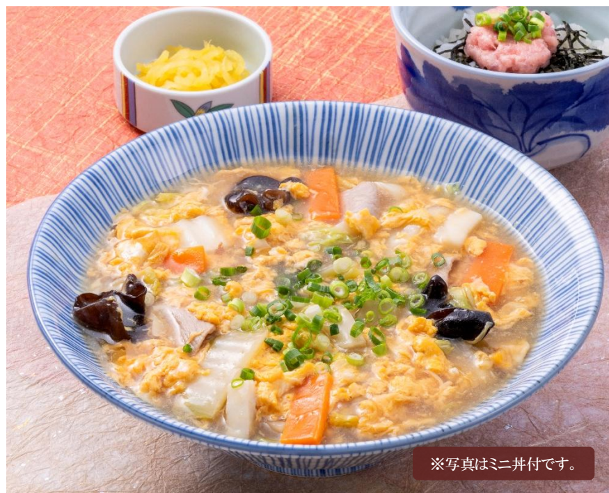
※写真はミニ丼付です。

醤油味ベースのつゆに、豆板醤とコチジャンの辛さがたまらないちゃんぽんうどんです。