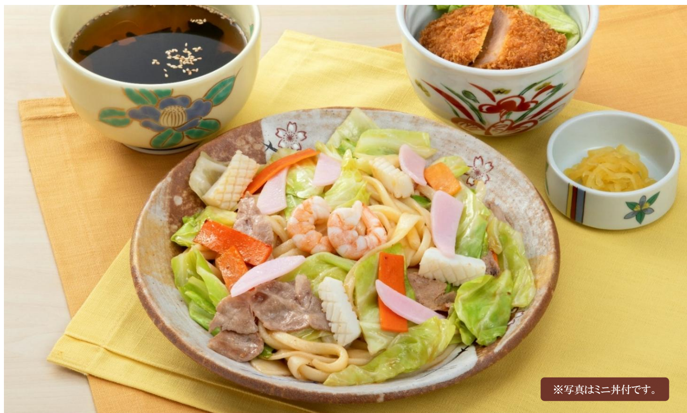
※写真はミニ井付です。

かつおだしのつゆに牛蒡と生姜の風味。味噌を使い、田舎風の煮込みうどんに仕上げました。