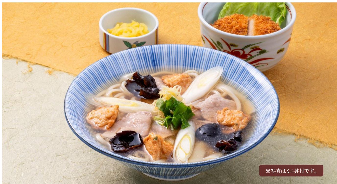
※写真はミニ丼付です。