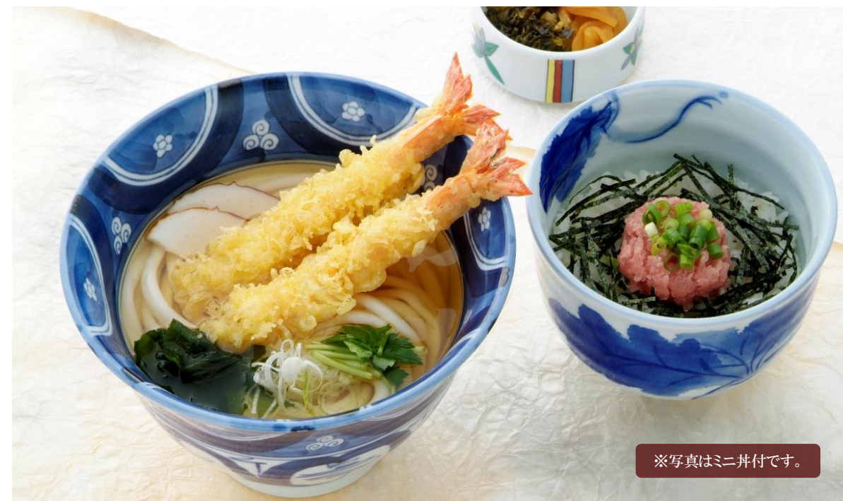
※写真はミニ丼付です。