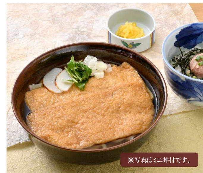
※写真はミニ丼付です。