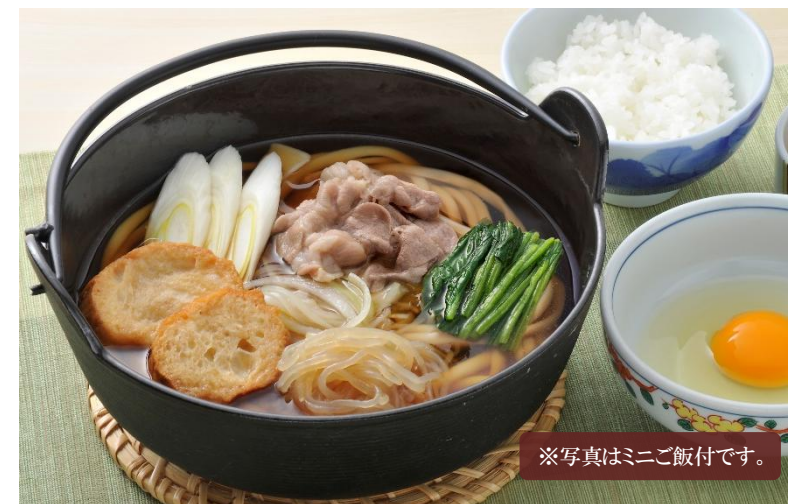
※写真はミニご飯付です。

播磨灘産牡蠣のエキス旨味あふれる、醤油ベースの特製ソースに仕上げました。ピリッと辛みのきいた焼きうどんを、わかめスープと一緒に召し上がり下さい。