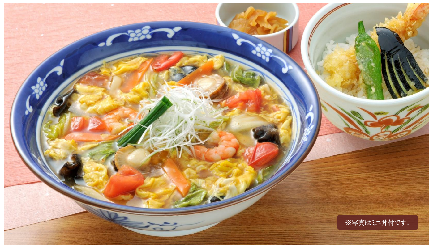
※写真はミニ丼付です。

コラーゲンが嬉しい白湯スープと、「むぎの里」自慢の「かけつゆ」で作ったちゃんぽんスープが人気です。7種類の具材と一緒にどうぞ。