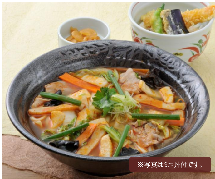
※写真はミニ丼付です。

「むぎの里」自慢のかけつゆを、たっぷりの野菜とピリッと胡椒をきかせた醤油仕立てのスープでお楽しみ下さい。