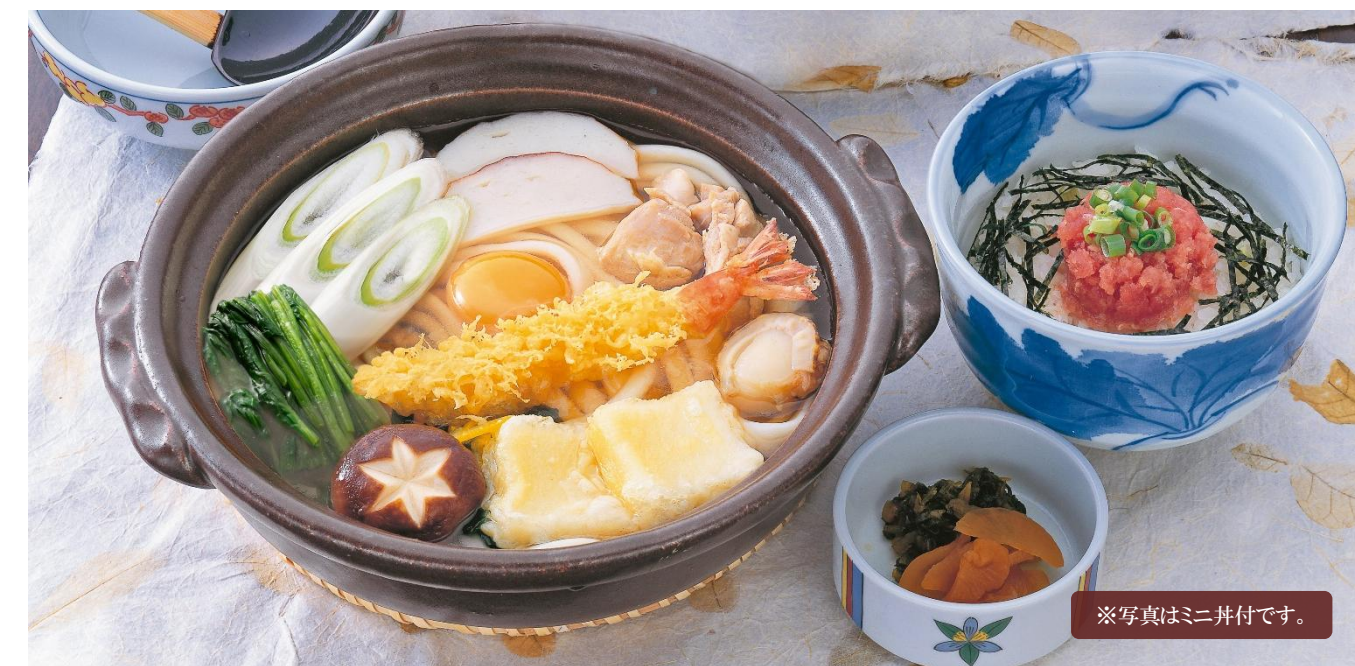
※写真はミニ井付です。

豚肉を野菜や仙台麩と一緒に、すき焼き風に仕上げました。溶き卵につけて召し上がり下さい。