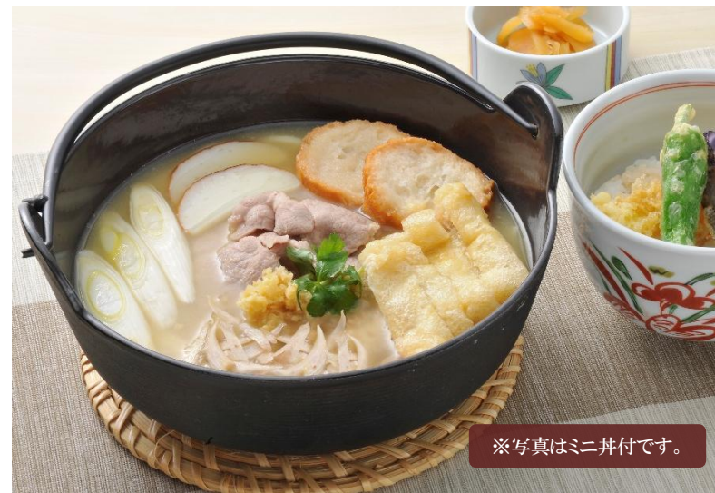
※写真はミニ井付です。

皿うどんの本場、長崎から取り寄せたパリパリ麺に、8種類の具材が入った醤油味ベースの「餡」をかけました。