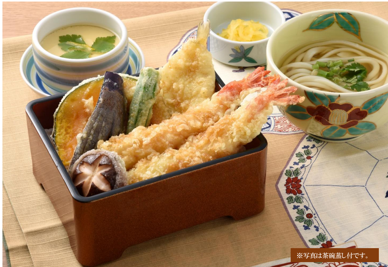
※写真は茶碗蒸し付です。