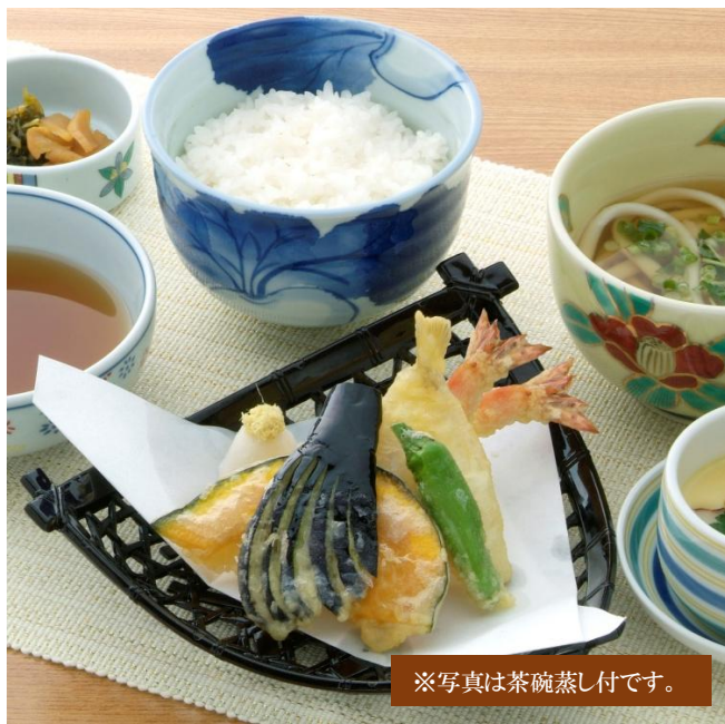
※写真は茶碗蒸し付です。