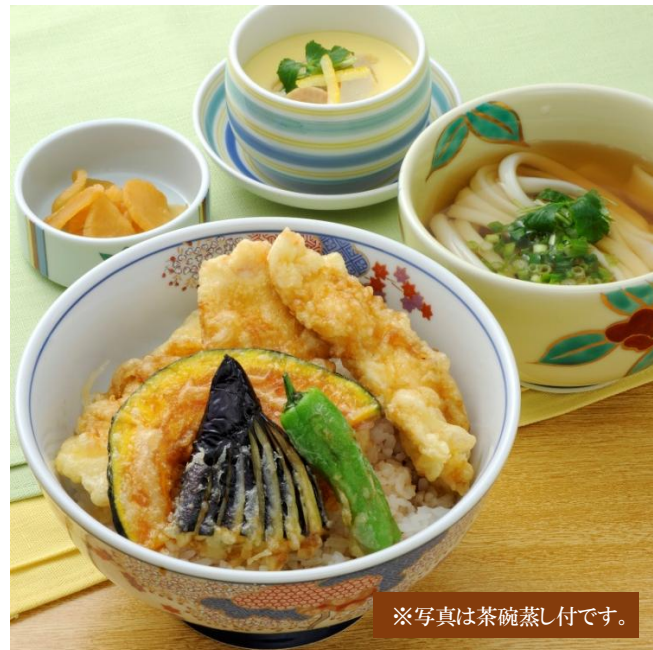
※写真は茶碗蒸し付です。