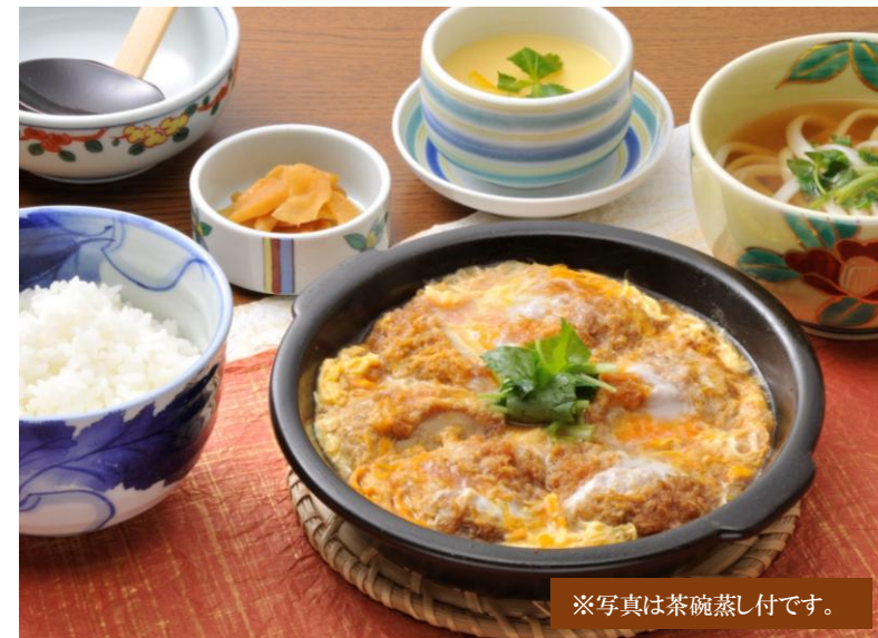
※写真は茶碗蒸し付です。

揚げたての大海老天ぷらと野菜天ぷらの美味しさが引き立つ、ちょっと豪華な天重はいかがですか。