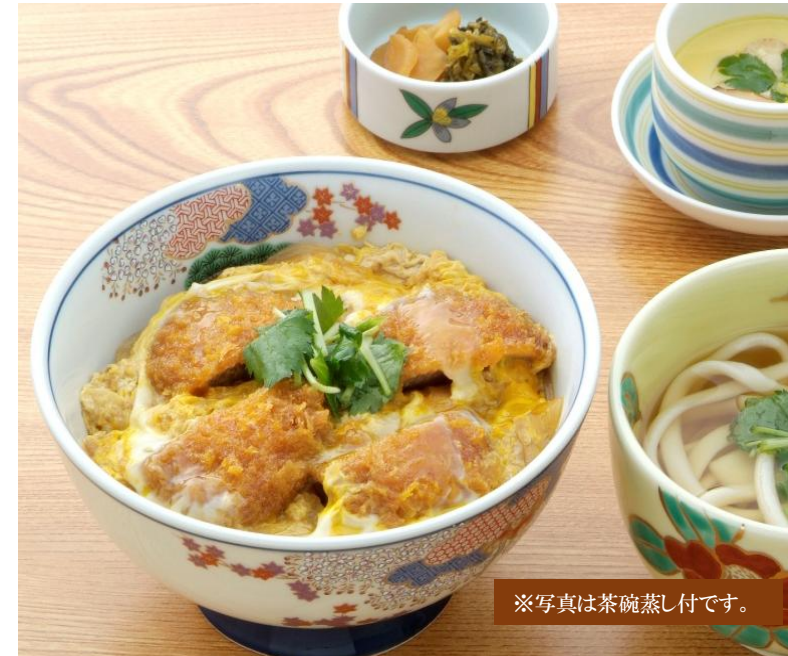
※写真は茶碗蒸し付です。