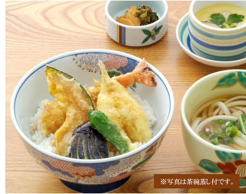
※写真は茶碗蒸し付です。