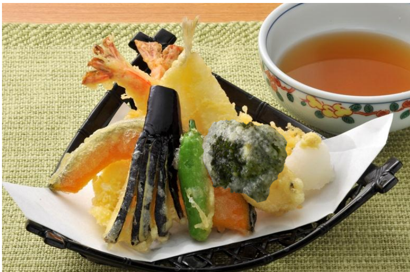
食材は季節により異なる場合がございます。